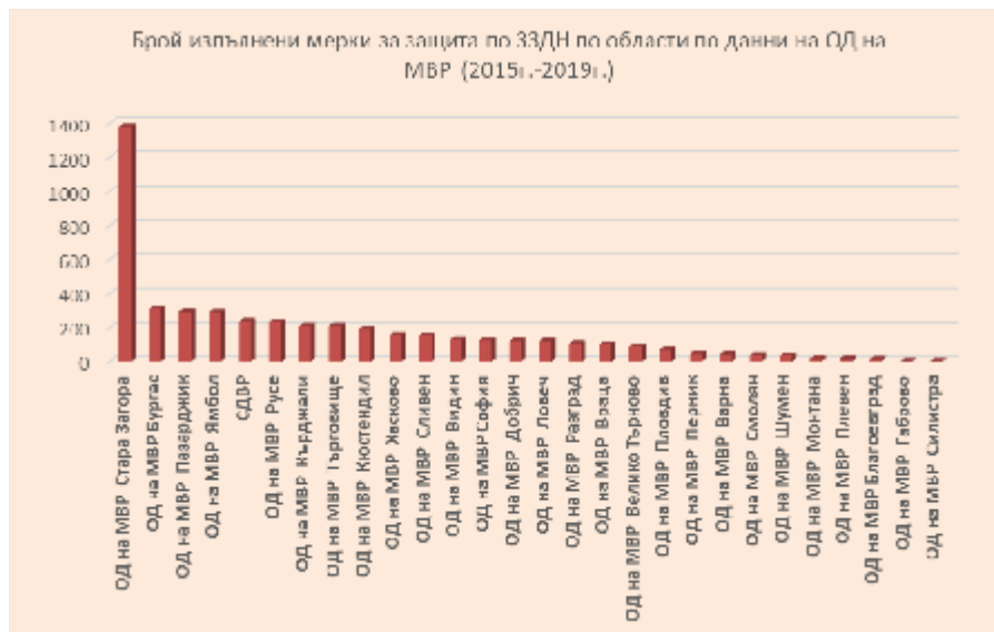
Фиг. 1. Брой изпълнени мерки за защита по ЗЗДН по области по данни на ОД на МВР (2015–2019)

до 13.03.2020 г. общо за България са погадени 819 сигнала, а за периода от 13.03.2020 г. до 13.05.2020 г. общо за страната са погадени 4875 сигнала. МВР констатира увеличение на постъпилите сигнали за домашно насилие само през последните три месеца с 4056 броя (получена информация от МВР по реда на ЗДОИ).