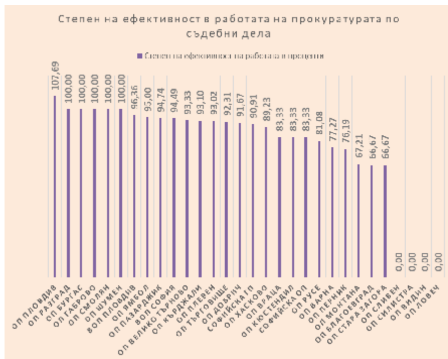
Фиг. 3. Степен на ефективност в работата на Прокуратурата по съдени дела, в %

Измерена е „Степен на ефективност в работата на прокуратурата по съдебни дела“, като са съпоставени показател „Брой образувани и разгледани съдебни дела“ и показател „Брой влезли в сила съдебни актове“ (фиг. 3). Ефективността се измерва чрез релация на данните от разгледаните съдебни дела и съответно влезлите в сила съдебни решения.