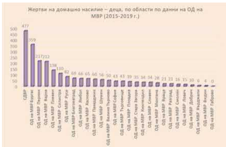
Фиг. 2. Жертви на домашно насилие – деца, по области, по данни на ОД на МВР (2015–2019)

Наблюдава се увеличение на броя на пострадалите деца през 2020 г., по данни от МВР. Сравнителният анализ показва, че за 2019 г. пострадалите деца от домашно насилие са 658, а за периода от 1 януари 2020 г. до 30 ноември 2020 г. техният брой вече е 823, като се запазва ръст на случаите на домашно насилие (фиг. 2).